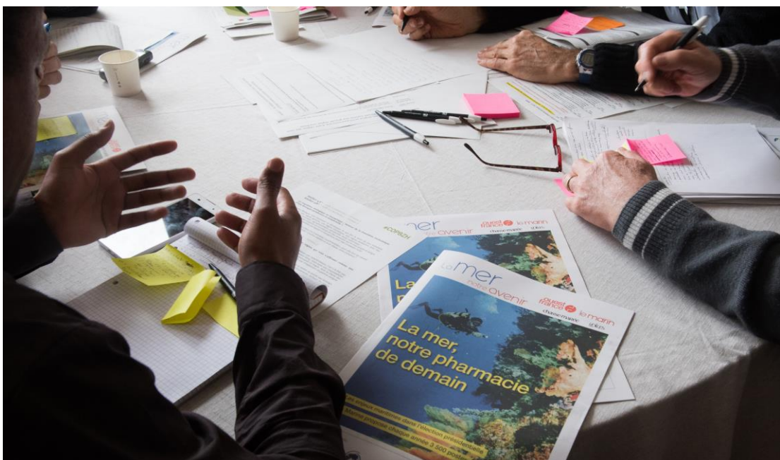
Carrefour des transitions, 9 mars 2017 - Ambiance lors des ateliers participatifs