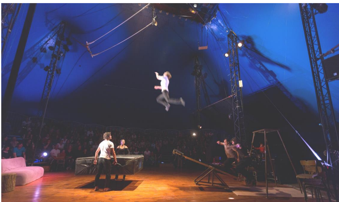
Risque zérO, compagnie Galapiat